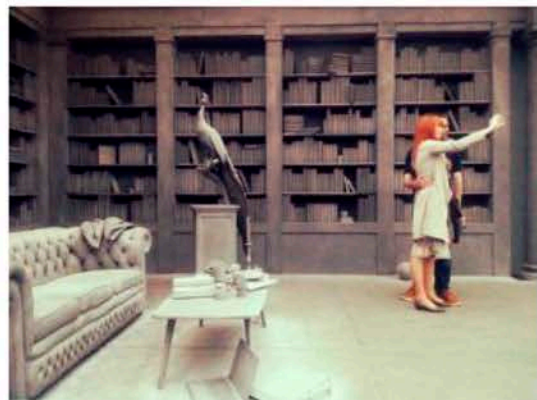
Hans Op de Beeck, The Collector's House , (2016). Courtesy of Marianne Boesky Gallery, Galleria Continua, and Galerie Krinzinger, Art Basel Unlimited, 2016.