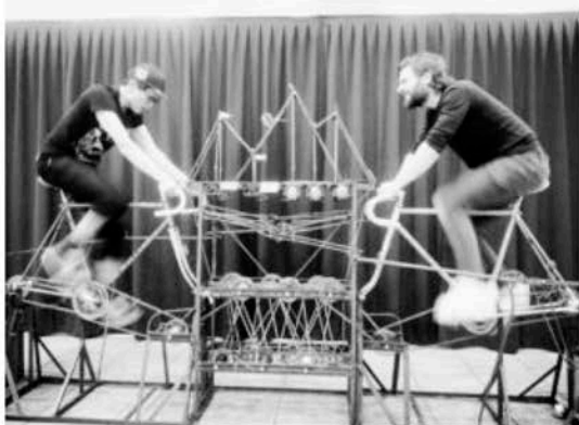
Ironsprint est exposé au Café ChezVelo du Swiss Art Awards à la Halle 4 de la Messe à Bâle.

Un ente fiera off è Liste, un evento secondario a cui hanno accesso una serie di gallerie che non possono partecipare (principalmente per questioni economiche) all'evento madre. Organizzato in un edificio industriale dismesso, una ex fabbrica di birra, si sviluppa su più piani e non propone nulla di entusiasmante, tant'è che l'architettura merita la mia attenzione molto più che l'arte esposta. Passo, dunque rapidamente tra gli stand espositivi catturata da poche cose e, finalmente, all'ultimo piano, quando avevo perso quasi le speranze, una galleria di Tokyo, Aoyama/Meguro, con la personale di Satoshi Ashimoto mi dà modo di riflettere sul ruolo intercambiabile dell'artista e dello spettatore quando