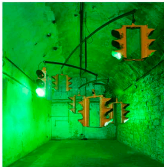
Ivan Navarro's Traffic

uita solo dalla fiera ufficiale, si muovono attorno ad essa una miriade di piccole fiere e piccoli eventi che approfittano dell'orda di visitatori amanti del genere. Nell'area di Messeplatz scoviamo anche Design Miami e Swiss art Awards. Quest'ultimo è un concorso dedicato a giovani artisti selezionati per accaparrarsi un premio di 25mila franchi. L'installazione che mi piace di più è fuori concorso, è in esposizione nel caffè ChezVelo all'ingresso dell'edificio: un trio folle di ragazzi (mecania.org) costruisce e anima macchine legendarie appartenenti ad un futuro distopico di ispirazione Tinguely: bici, catene, acqua, biglie metalliche ed il gioco è fatto. Il mio premio virtuale Swiss Art Awards va a loro. Purtroppo non ho i 25mila franchi da consegnare.