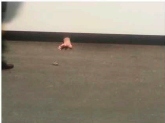
Laura Lima's Ascenseur at Art Basel Unlimited 2016.

di telecamere di sorveglianza, protagonisti delle immagini i fruitori del padiglione stesso. Ne scaturisce un sentimento a metà tra esibizionismo nel vedersi protagonisti di un'opera d'arte e la seccatura per la presa di coscienza del trattamento di violazione della privacy che subiamo quotidianamente in modo inconsapevole.