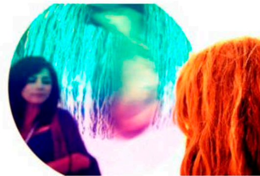
Mirror (Laser Red to Oriental Blue) 2016 Anish Kapoor

di artisti emergenti, tende oggi, dopo quasi cinquanta anni, ad ispirarsi neanche troppo liberamente a quell'arte lì. Affascinano le sculture aliene di Anish Kapoor che meritano almeno un selfie, storpiato dalla forma concava delle sue opere, inglobano figura e sonorità in un horror vacui impastato ad un certo misticismo.