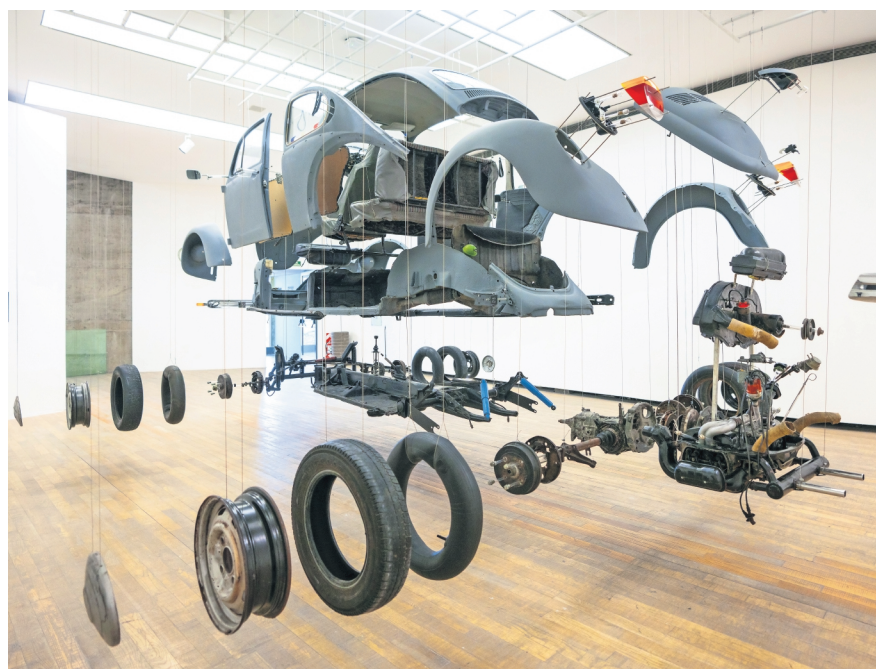
La famosa Cosmic Thing , de Damián Ortega, es un "vocho" desarmado con todos sus componentes suspendido en el aire.

Espejos de México , en Buenos Aires, reúne obra plástica de Julieta Aranda, Abraham Cruzvillegas, Rafael Lozano-Hemmer y Damián Ortega, quienes muestran otra diversidad cultural del país