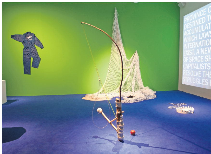
Rescatando mi propio cadáver (un conjunto alterno de peldaños para el ascenso a la oscuridad), de Julieta Aranda, reflexiona sobre la condición del humano en el siglo XXI.