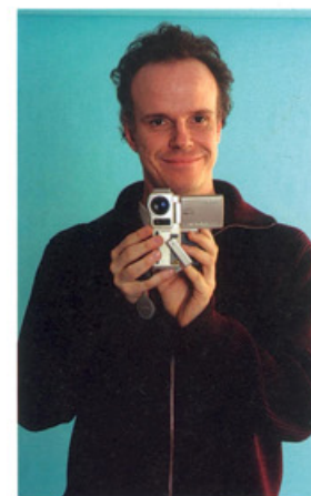
Hans Ulrich Obrist.